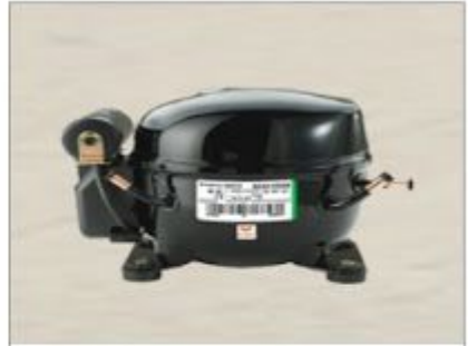
EGAS 100 HLR