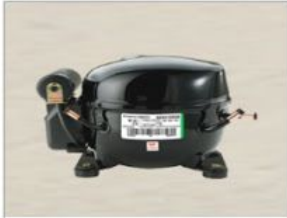
EGAS 90 HLR