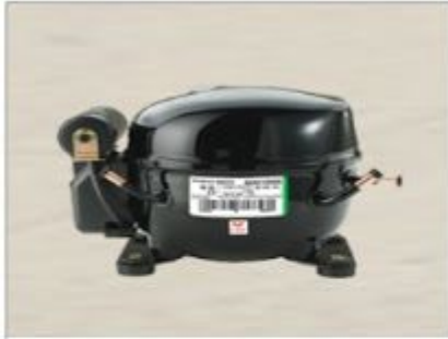
EGAS 80 HLR