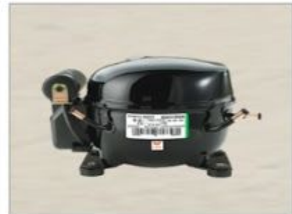
EM 55 HNR