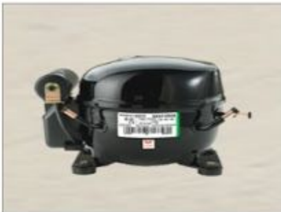
EM 30 HHR