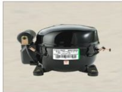
EM 45 HNR