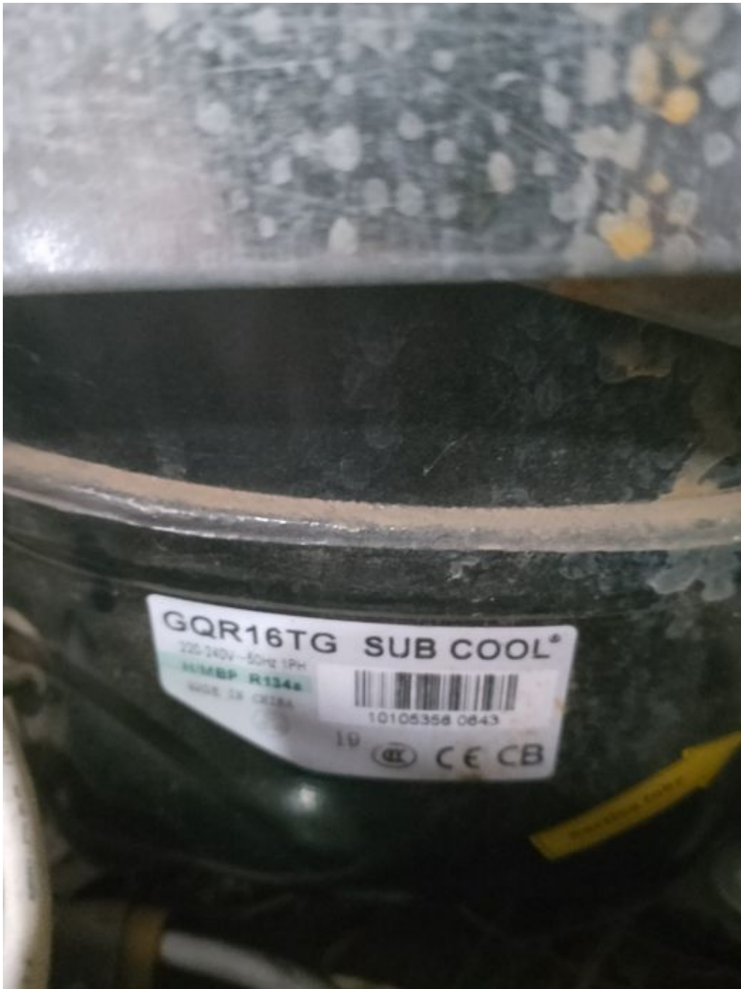
GQR16TG, light, commercial, refrigeration, compressor ,1 / 2+ HP, 220V/50Hz, CSIR, capacitor:80UF, R134A