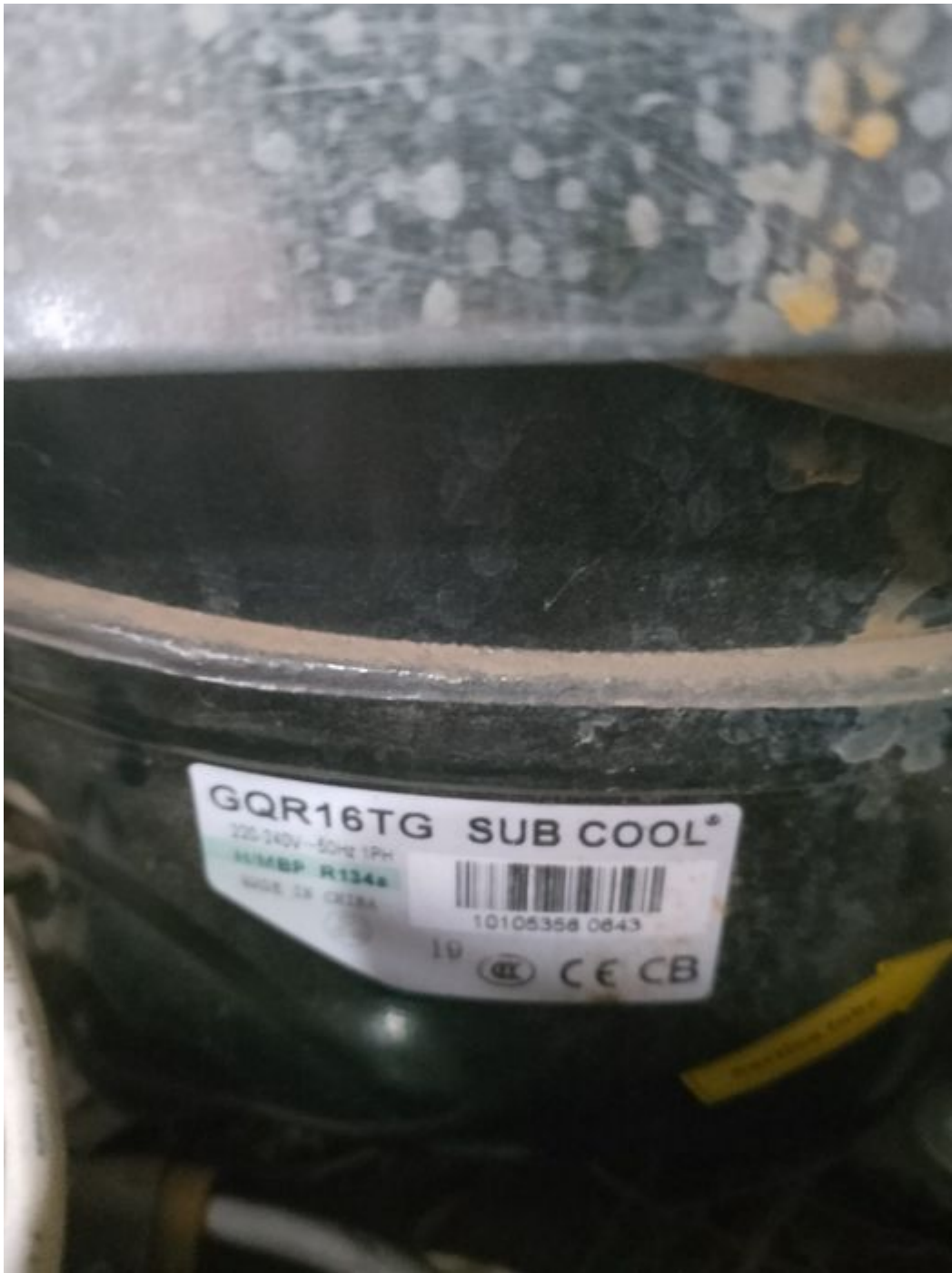
GQR16TG, light, commercial, refrigeration, compressor ,1 / 2+ HP, 220V/50Hz, CSIR, capacitor:80UF, R134A