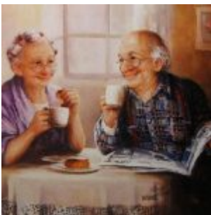
mbsm_dot_pro_Live_Life_Together.jpg (54 KB)