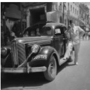
mbsm-dot-pro-Abdelaziz-El-Aroui.jpg (72 KB)