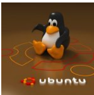
mbsm_dot_pro_ubuntu1.jpg (65 KB)