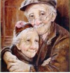
mbsm_dot_pro_Live_Life_Together2.jpg (64 KB)