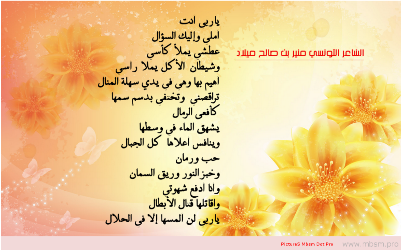
mbsm_do_pro_miled_mounir.png (601 KB)