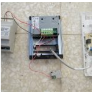
mbsmdotpro-interphone4.jpg (134 KB)