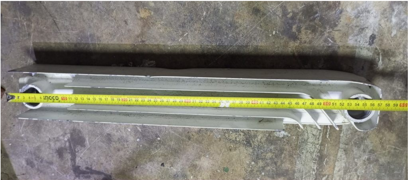
Private Picture Copyright: WWW.MBSM.PRO