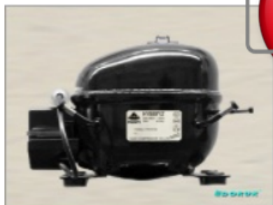
AE 1360 Y 1 / 5 HP