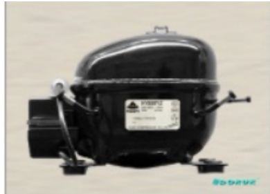
AE 1350 Y 1 / 6 HP