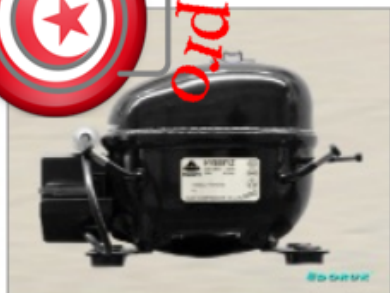
AE 1370 Y 1 / 4 HP